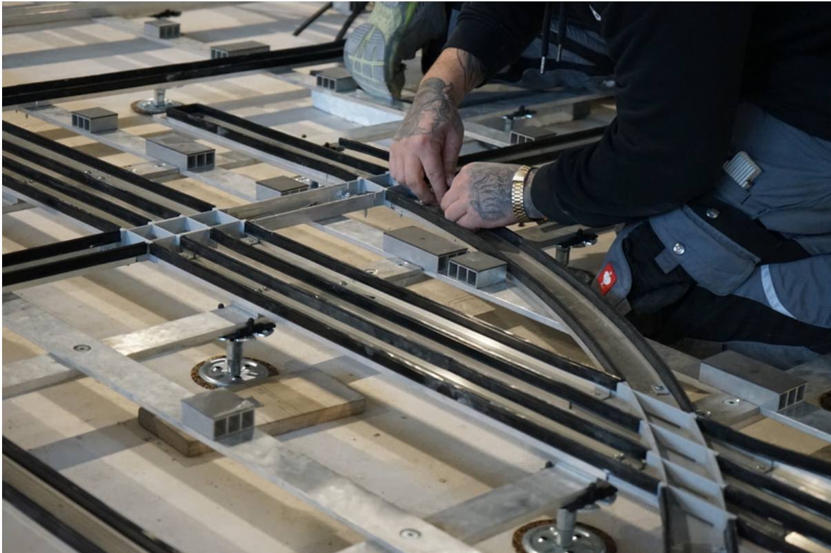
Konstruktion der elastischen Metallunterkonstruktion und Kanäle für LED-Markierungen.