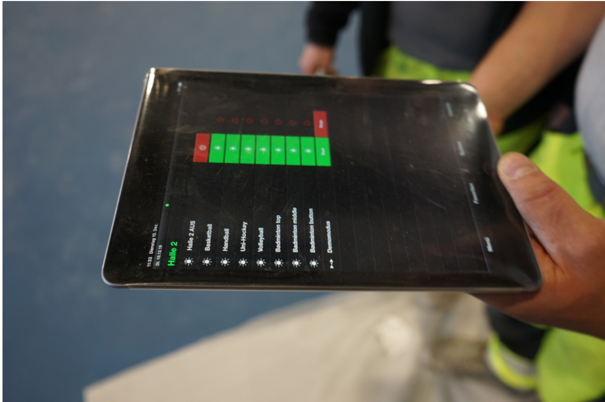
Steuerung der LED-Markierungen mit einem Tablett.